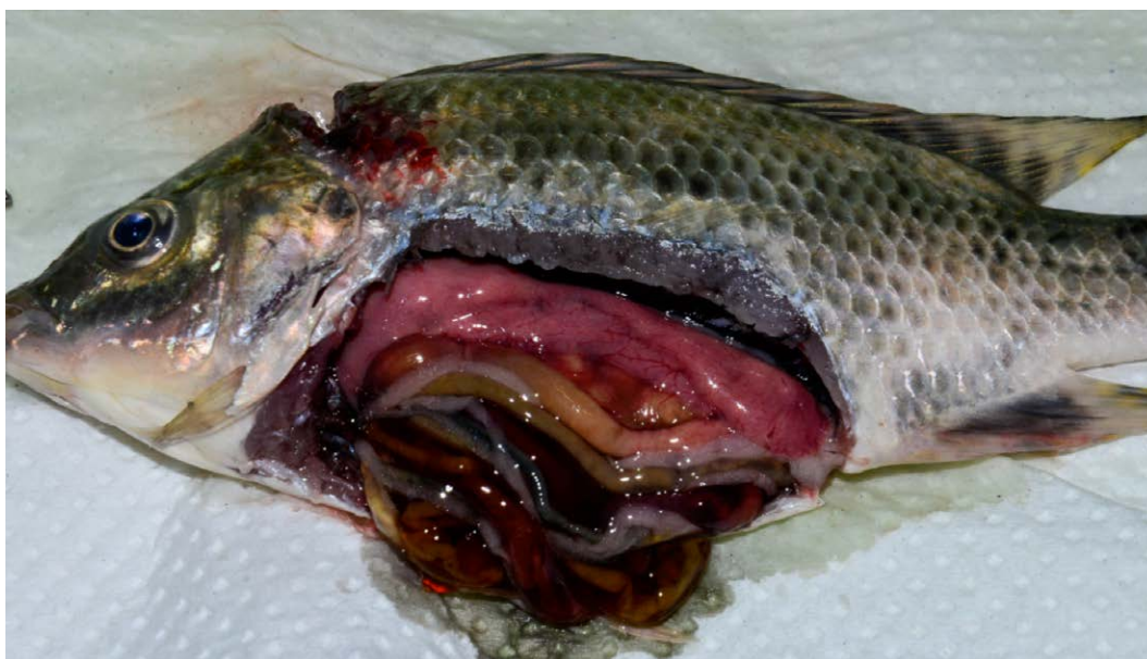
Figura 2. Principales patologías internas: Hígado friable y decolorado, vasculitis en hígado, congestión y hemorragia intestinal.

Nota: Fuente propia de la investigación.