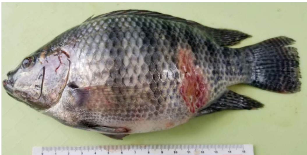
Figura 1. Principales patologías externas: Úlcera cutánea con áreas hiperémicas en diversas partes del cuerpo.

Shewanella presentan una estrecha relación con la signología de úlceras cutáneas, áreas hiperémicas, melanización corporal, hígado pálido y friable. Estos géneros corresponden al grupo catalogado como septicemia