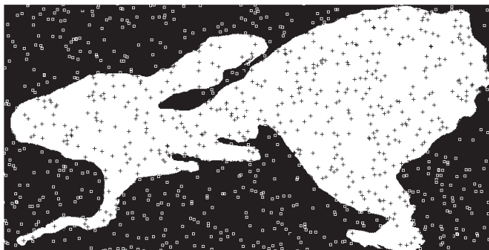
Figura 2: Instantánea obtenida al arrojar 500 puntos al azar. Área estimada: 8.5 \text{ km}^2 .

preguntamos con la primitiva pixel si es blanco (RGB: 255, 255, 255) y, en ese caso, se dibuja una cruz y se incrementa el contador de sucesos exitosos ( Nb ); si no es blanco, sólo se dibuja un cuadradito (Fig. 2). Con la primitiva es ( escribe ) se presenta el valor de la estimación del área luego de repetir N veces el procedimiento muestreo .