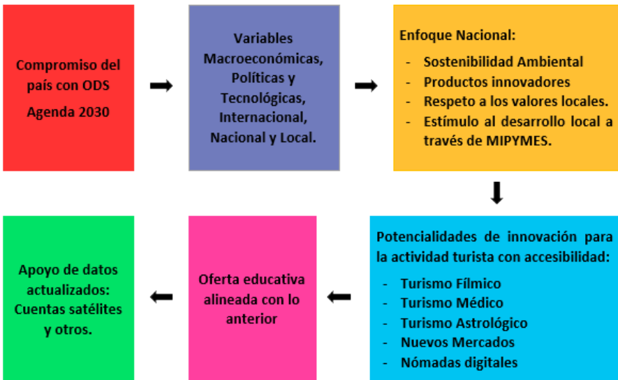
Figura 6. Ruta Turismo Innovador, Moderno y Creativo, Costa Rica

Las rutas turísticas articuladas a los gustos y preferencias de los consumidores potenciales colaboran de manera directa con el desarrollo territorial, impulsando las oportunidades de crecimiento económico y una mejor distribución del ingreso local.