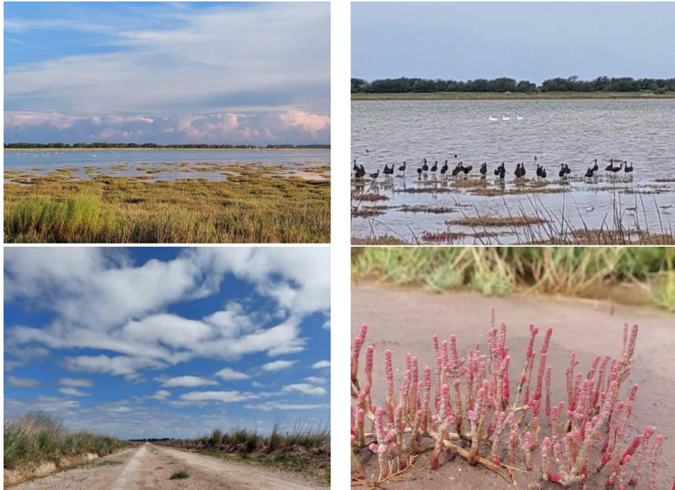
Figura 2. Reserva Querla Lobo

no permanente, de poca profundidad y supeditados a las lluvias y el nivel de la capa freática. Estos sitios constituyen reservorios de biodiversidad de gran importancia, tanto de flora como fauna, dado el contexto rural-productivo en el que se emplazan (Romano y Brandolin, 2017).