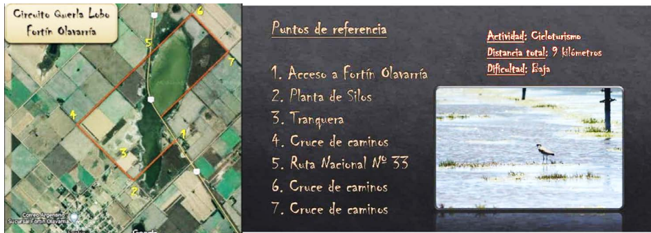
Figura 3. Circuito de cicloturismo Rural Bike