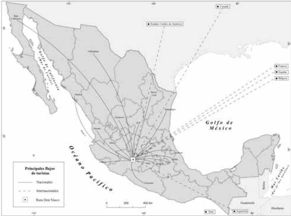
Figura 4. Flujos turísticos nacionales e internacionales a Michoacán.