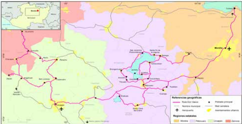
Figura 1. Localización de la ruta Don Vasco, Michoacán, México.