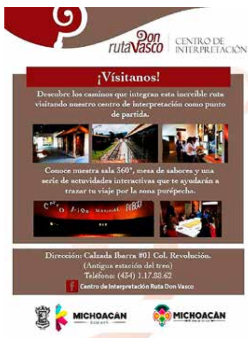
Figura 2. Publicidad del Centro de Interpretación Ruta Don Vasco, Michoacán, México.