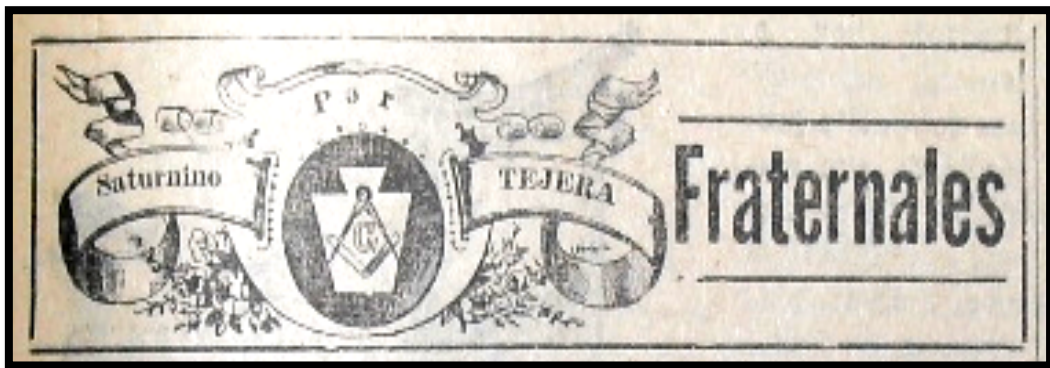
Imagen 4 Logotipo de la sección FRATERNALES