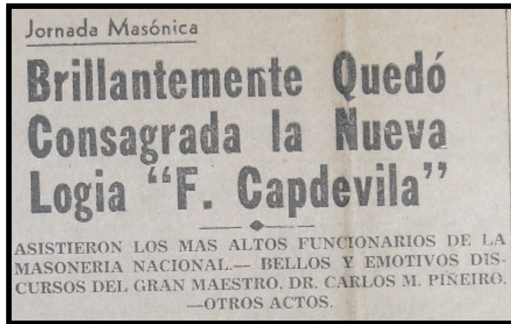
Imagen 5 Noticia aparecida en el diario local El Comercio sobre la visita del Gran Maestro de la Logia de Cuba a Cienfuegos

Fuente: El Comercio , 25 de mayo de 1953, 1.