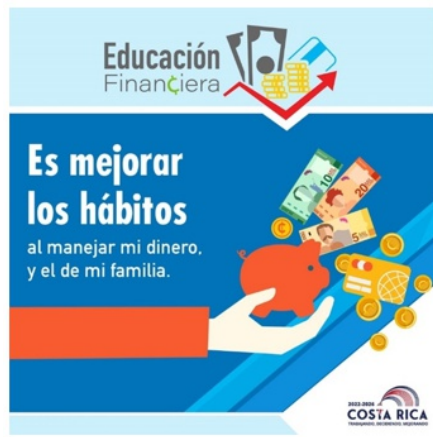
Figura 2 Ejemplo de consejo brindado dentro de la ENEF

Descripción: se lee «Educación financiera es mejorar los hábitos al manejar mi dinero y el de mi familia», con el logo de Gobierno de Costa Rica en la parte inferior.