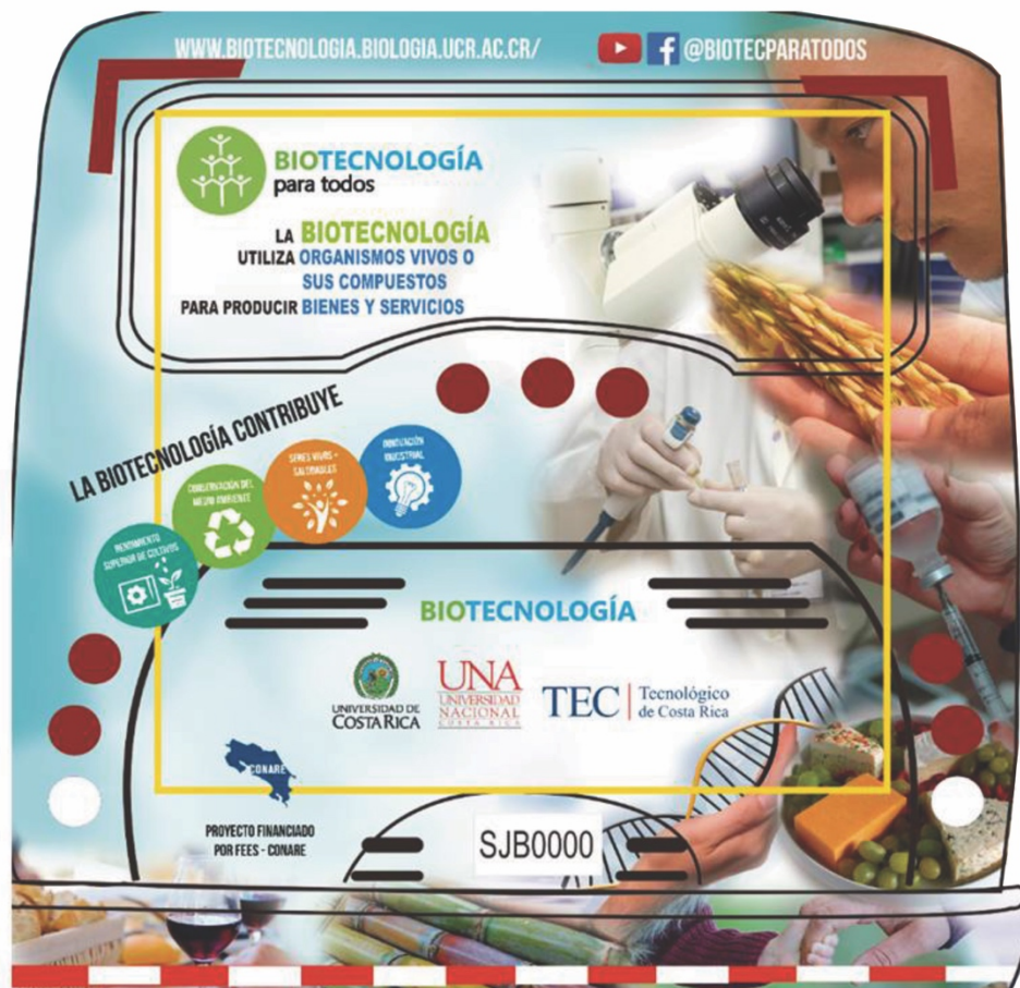
Fig 3. Campaña de información y divulgación del proyecto en la parte trasera de los buses de la ruta de La Periférica en San José.

El público general tuvo acceso a la información presentada de manera sencilla y comprensible a través de notas informativas del proyecto que se publicaron en Impacto TEC de Radio Monumental, la Revista Matutina de Radio Universidad, y el programa Desayunos de Radio Universidad. Asimismo, se escribió un artículo de divulgación en Revista InvestigaTEC ( https://repositoriotec.tec.ac.cr/handle/2238/7444 ), en el Boletín Informativo del CONICIT ( http://www.conicit.go.cr/prensa/boletincyt/historico_boletincyt/Biotecnologia.aspx ) y en el fascículo Ciencia más Tecnología de la Universidad de Costa Rica ( https://issuu.com/ct.ucr/docs/c_t_19_enero_2017 ). De igual manera, el público general tuvo contacto durante los meses de marzo a junio del 2017 con una campaña de información y divulgación del proyecto que se pauto en parte trasera de los buses de la ruta La Periférica en San José (Fig. 3).