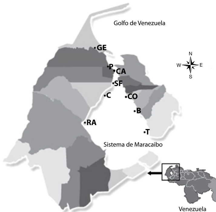
Fig. 1. Localidades de muestreo donde se encontró P. platyrachis dentro del Sistema de Maracaibo. GE=Gran Eneal, P=Peonías, CA=Capitán Chico, SF=San Francisco, C=Curarire, CO=Ciudad Ojeda, B=Bachaquero, RA=Desembocadura Río Apon y T=Tomoporo de Agua.

**=No se observaron los ejemplares machos ya que son muestras que reposan en el MBLUZ antes de la reidentificación de la especie.