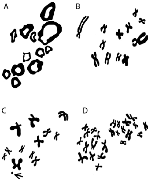
Fig. 2. Dispersiones cromosómicas bivalentes tempranas de S. baudinii con 12 cromosomas profasicos II en forma de anillo (A), 12 cromosomas metafasicos II (B), 12+1 cromosoma "B" (flecha) en metafase II (C) y 24 cromosomas en metafase I (D).

Fig. 2. Early bivalent chromosome spreads from S. baudinii with 12 chromosomes ring shaped at prophase II (A), 12 chromosomes at metaphase II (B), 12+1 "B" chromosome (arrow) at metaphase II (C) and 24 chromosomes at metaphase I (D).