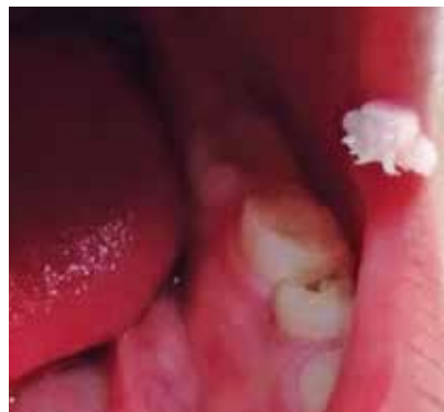
Fotografía Frontal 1. Boca Cerrada

Al paciente se le realizó biopsia escisional de la lesión y se procedió a realizar puntos de sutura. Los resultados expresaron que la neoformación encontrada en el infante de 9 años presentaba fragmento de tejido de forma papilar que medía 6cm de alto x 4cm de ancho, color blanquecino y consistencia anulada. Además en los cortes se observó proliferación del epitelio plano estratificado con papilomatosis con acantosis e hiperqueratosis, células vacuoladas con núcleos pequeños hiper cromáticos, lo cual histológicamente significaba una verruga vulgar bucal. Clínicamente presentaba las características de una verruga vulgar, presentaba as-