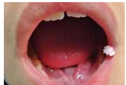
Fotografía frontal 2 . Boca abierta.