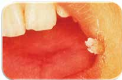
Imagen 1: Verruga, Jiménez y col. 2001

Son comunes en niños, pero ocasionalmente aparecen en la adolescencia. La piel de las manos es frecuentemente el sitio de infección. Pero una vez que la mucosa oral ha sido implicada, puede encontrarse en el borde bermellón, mucosa labial o en la parte anterior de la lengua.