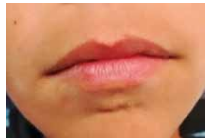
Fotografía Frontal 1. Boca Cerrada

En las siguientes fotografías se muestra la apariencia clínica de la verruga vulgar bucal del paciente (Fotografías 1, 2, 3)