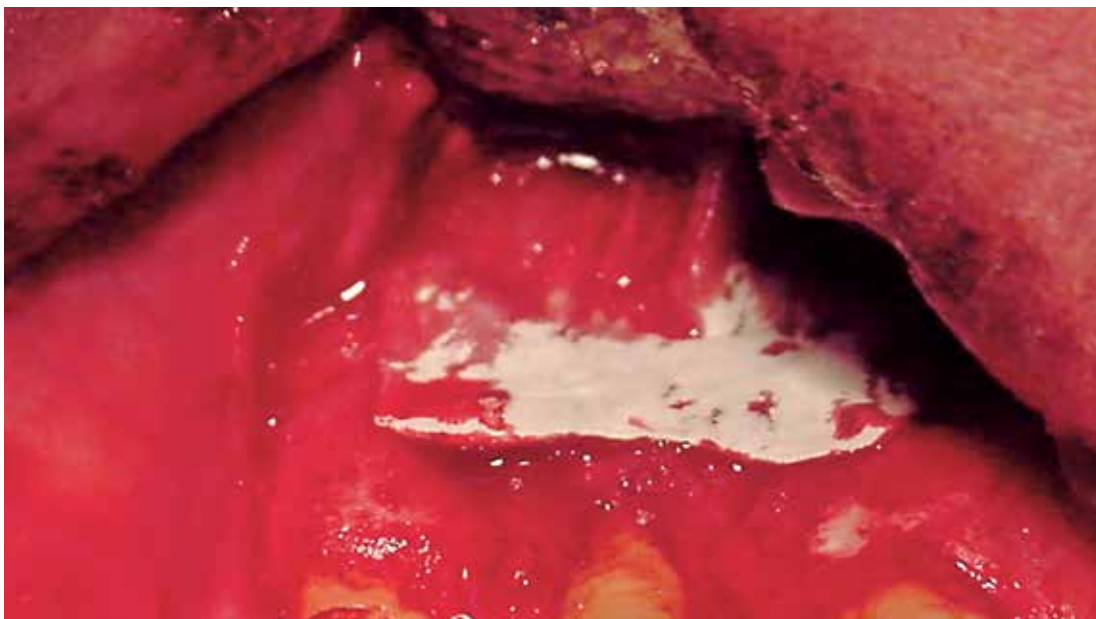
Fig 2: Membrana colágeno Tipo I-III Bio Gide (Geistlich Pharma)