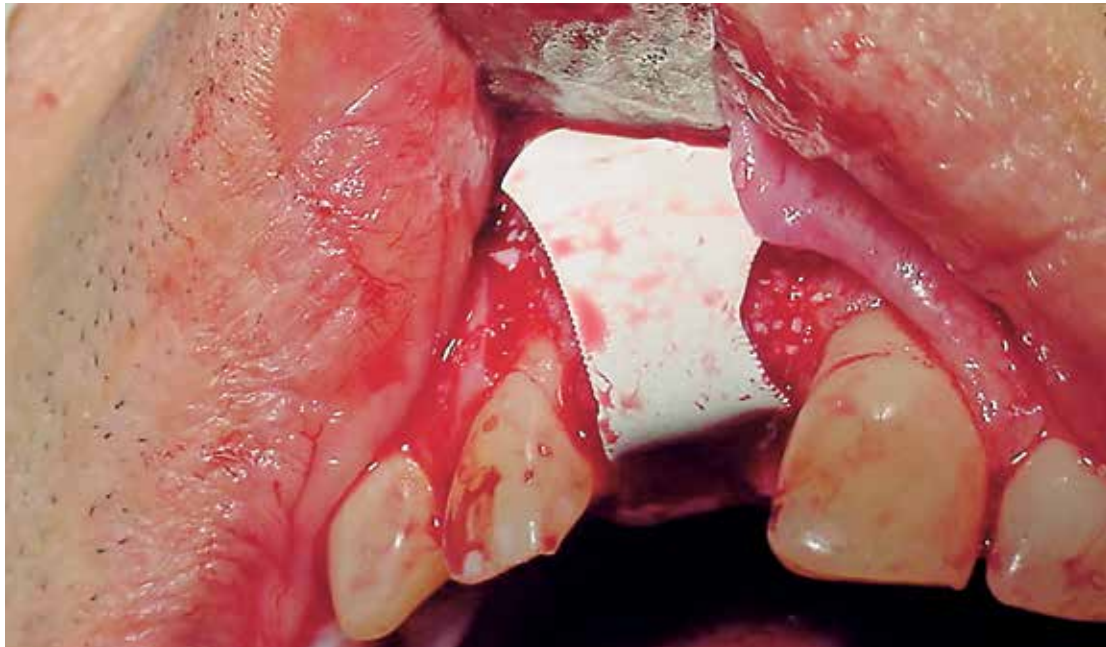
Fig 4: Membrana de politetrafluoroetileno CYTOPLAST (Osteogenics, Biomedical)