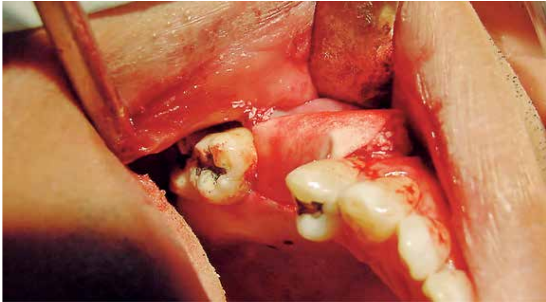
Fig 3: Membrana ácido poliláctico CYTOPLAST (Osteogenics, Biomedicals)