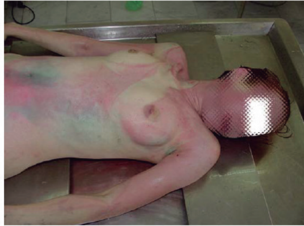
Imagen No.2. Coloración rojo cereza característica.