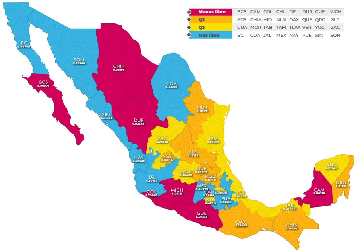
Figura 3. Agrupación de las entidades, nivel de LE 2015, México.

En la Tabla 1 se presenta la matriz de correlaciones entre las variables involucradas. Se observa que entre el LOGLA y LOGLE existe una correlación positiva, pero no estadísticamente significativa, aunado a que el coeficiente es sumamente reducido; dicho número resume bien la información contenida en las series y la tendencia que se observa entre ellas. Destaca que LOGPIBMAN y LOGPIBMAN presentan correlaciones positivas con LOGLA que son estadísticamente significativas. La variable CRISIS tiene el signo esperado de la correlación con LOGLA, pero no es significativo.