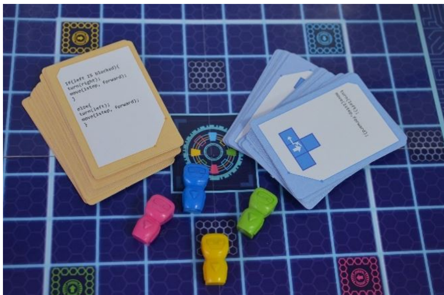
FIGURA 2. Componentes del juego de mesa Robot Wars .