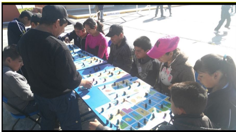
FIGURA 4. Feria de juegos tradicionales: estación la lotería

En la estación de carrera de costales , al igual que la cuerda, los padres y madres de familia no querían saltar con el costal hasta el otro extremo por diferentes motivos: me duele las rodillas, están lastimadas , algunos no traían la ropa adecuada, también influía la edad de la madre o padre, y algunos abuelos; pero no fue motivo para no apoyar a que las niñas y niños a participar y saltar en lugar de sus madres y padres; la estación del trompo y yoyo resultó difícil para las niñas y niños y fácil para las personas adultas, pues esos fueron sus primeros juguetes cuando eran niños o niñas, con los que pasaron horas jugando, pero los niños y niñas se desesperaron porque no podían realizarlo; la estación de lotería fue un juego de mucha alegría y entusiasmo por parte de los padres y madres, pues tenían que poner mucha atención para escuchar y observar las figuras que tenían para poder ganar. Ver Figura 4.