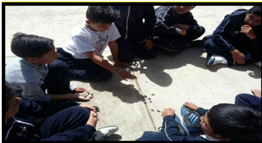
FIGURA 2. Juego tradicional las canicas

se quema, el palo encebado, las canicas y los hoyitos; b) juegos tradicionales sin objetos: el avión, las estatuas, las rondas y el stop. En la Figura 2, se puede observar a un grupo jugando canicas.