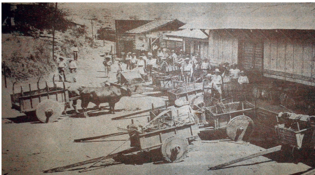
Figura 2. Estación del tren N° 19, Río Grande de Atenas, 1922.

Los cantones de Atenas, Palmares y San Ramón tuvieron un pasado compartido que tardó décadas en forjarse, para luego quedar resquebrajado, a partir de obras