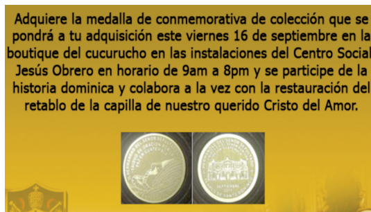
Figura 8. Medallas de colección.

Así también, la venta de medallas de colección por parte de la Hermandad del Señor Sepultado de Santo Domingo (Ver figura 8). Esta última cofradía además cuenta con una boutique en la cual ofrece otra serie de productos que incrementan el erario de la hermandad.