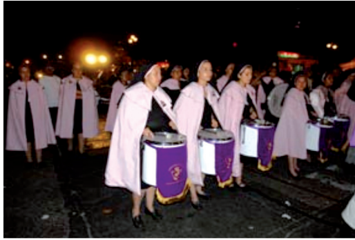
Figura 10. Hermandad de Mujeres.