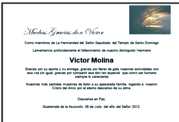
Figura 4. Fallecimiento de un Hermano.

haber, injustificadamente, suspendido el derecho de “una misa por la intención de su alma, al ocurrir su fallecimiento” 23 .