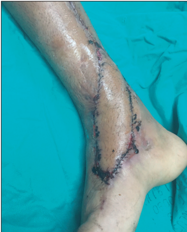
Figura 3. Resultado final de la cobertura del defecto cutáneo de miembro inferior derecho con el colgajo cutáneo de perforante de la arteria tibial posterior derecha. Nótese el cierre directo del sitio donador.

rotó 90 grados sobre su pedículo central, similarmente a una hélice, para cubrir defectos de piel a nivel de codo y axila por resección de contracturas cicatrizales. Posteriormente Hallock en el 2006 10 describió un colgajo similar basado en un vaso perforante esqueletonizado, pero la isla de piel fue rotada 180 grados, donde la aleta mayor cubría el defecto primario y la aleta menor facilitaba el cierre de la zona donadora.