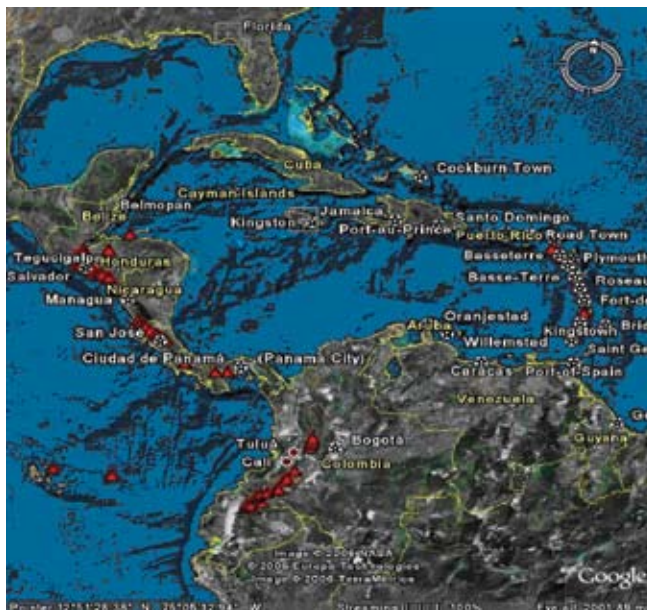
Figura 1. Cinturón de Fuego del Pacífico. Áreas de actividad volcánica importante en América Latina.

A pesar de que es un problema muy difundido en América Latina, con gran cantidad de casos en Nicaragua, en la zona de Matagalpa, 10,11 que tiene características geológicas similares a las de Costa Rica, el país no ha reportado casos de patologías correlacionadas directamente con arsenicismo (enfermedad por arsénico); no se sabe si es porque no se reconocen las lesiones (pues se pueden confundir con otras patologías), o porque del todo no hay acuíferos o pozos contaminados con arsénico asociados a consumo masivo de agua.