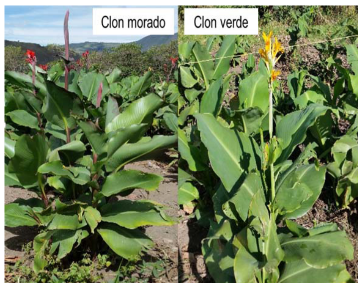
Figura 1. Cultivar morado y cultivar verde de achira ( Canna edulis , Ker) utilizados para el estudio de densidades de siembra y fertilización en el municipio La Cruz, Nariño, Corporación Colombiana de Investigación Agropecuaria (AGROSAVIA), Centro de Investigación Obonuco, Colombia. 2016-2017.