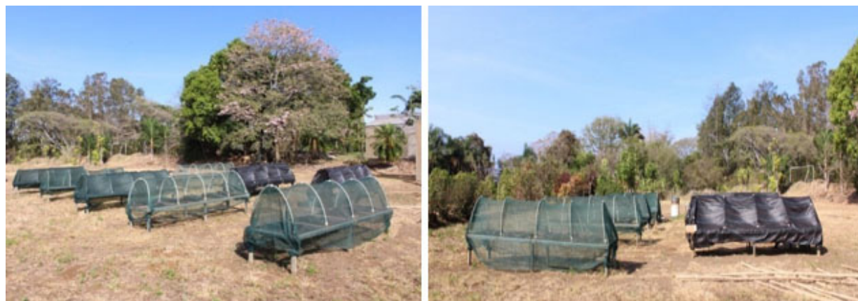
Figura 2. Micro túneles colocados en campo abierto para observar la influencia del porcentaje de sombra sobre la germinación de semillas escarificadas y no escarificadas de I. rugosum Salisb. Estación Experimental Agrícola Fabio Baudrit Moreno (EEAFBM). Alajuela, Costa Rica. 2016.

Cada sarán se colocó sobre tubos de PVC (policloruro de vinilo) de 1,27 cm, y se aseguró con prensas. Los tubos se encontraban en forma de arco a un ancho de aproximadamente 90,0 cm y 70,0 cm de altura máxima sobre una mesa construida a base de acero y con malla metálica tejida galvanizada en la parte superior. Las medidas de la mesa fueron de 4,0 m de largo, 1,0 m de ancho y 0,6 m de alto. Cada micro-túnel se replicó dos veces, para un total de diez micro-túneles, los cuales fueron colocados en un campo al aire libre, siguiendo la dirección de norte a sur, en dos filas, con una separación entre ellas de 2,0 m. La separación entre micro-túneles fue de 3,0 m (Figura 2).