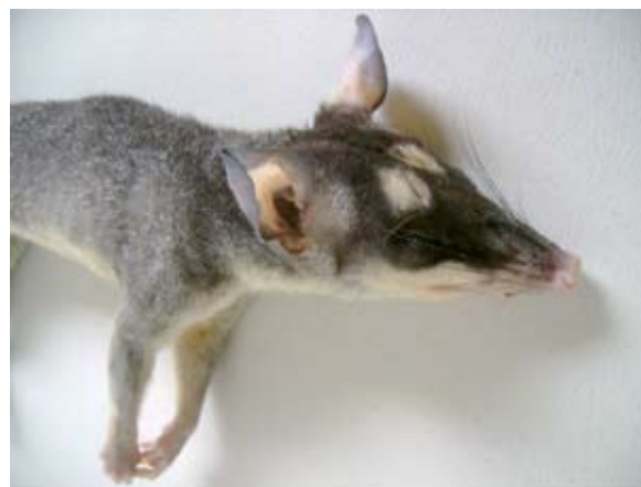
Figura 2. Zorro de cuatro ojos ( Philander opossum ), colectado en Santa Cecilia, La Cruz, Guanacaste, Costa Rica, mostrando las dos manchas blancas sobre los ojos, las que dan origen a su nombre común. (Foto J. Monge). 2009.

Las capturas obtuvieron como resultado un animal para los meses de marzo y junio, y de dos especies en mayo, julio y agosto (Cuadro 1). La presencia de individuos juveniles en estos meses, indica que desde mediados de época seca y la lluviosa podría existir actividad reproductiva de la especie en el sitio de estudio, según lo observado por Biggers (1966) en Nicaragua y Fleming (1973) en Panamá. La muestra de estudio indicó que hubo mayor presencia de machos, representando el 75% del total. Esto puede obedecer a una mayor representatividad de los machos sobre