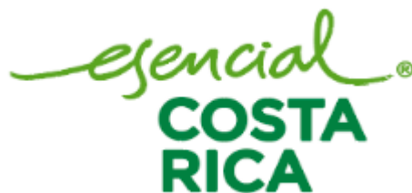
FIGURA 2. Costa Rica, marca utilizada a nivel internacional