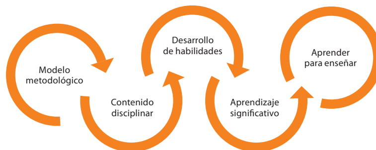
Figura 1. Metodología del enfoque de aprendizaje profundo AP