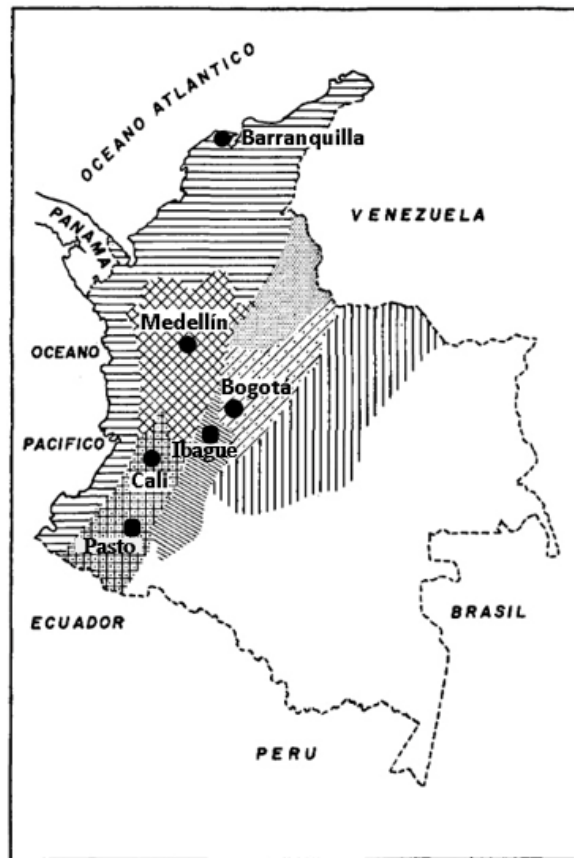
Figura 2. Localidades en Colombia. Imagen tomada y adaptada de Flórez (1961)

costeño (Atlántico y Pacífico), antioqueño, nariñense-caucano, tolimense, cundiboyacense, santandereano y llanero. Cada uno de ellos, excepto los dos últimos, representados por Barranquilla, Medellín, Pasto-Cali e Ibagué, respectivamente (ver Figura 2).