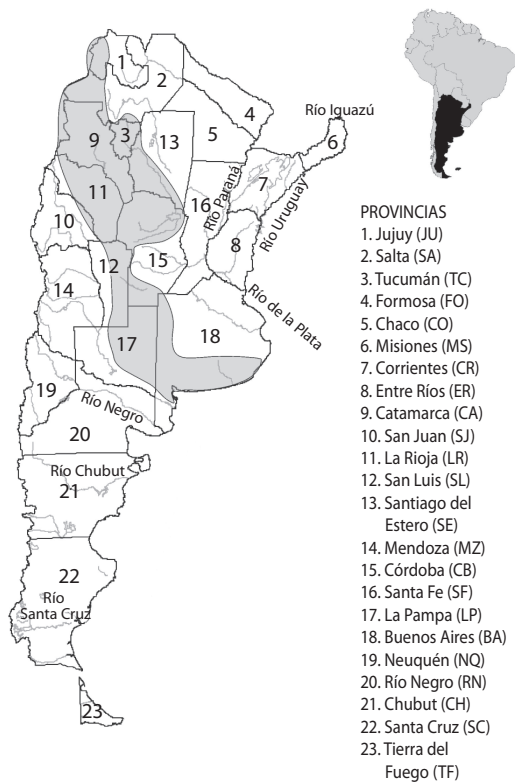
Fig. 1. República Argentina con los principales ríos y provincias. Área gris: Zona de Transición.