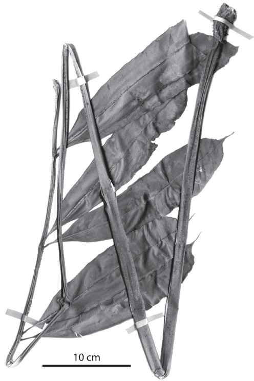
Fig. 3. Ejemplar del nuevo registro de D. erecta H. Tuomisto et R.C. Moran (A. Rojas 899, INB) (escala: 10 cm).

Se diferencia del material sudamericano por pinnas oblanceoladas (vs. oblongas) y pinnas basales con ápice aristado (vs. cuspidado), por lo demás no parece presentar diferencias significativas. Por no presentar yema apical se parece al material del lado este de los Andes indicado por Tuomisto y Moran (2001).