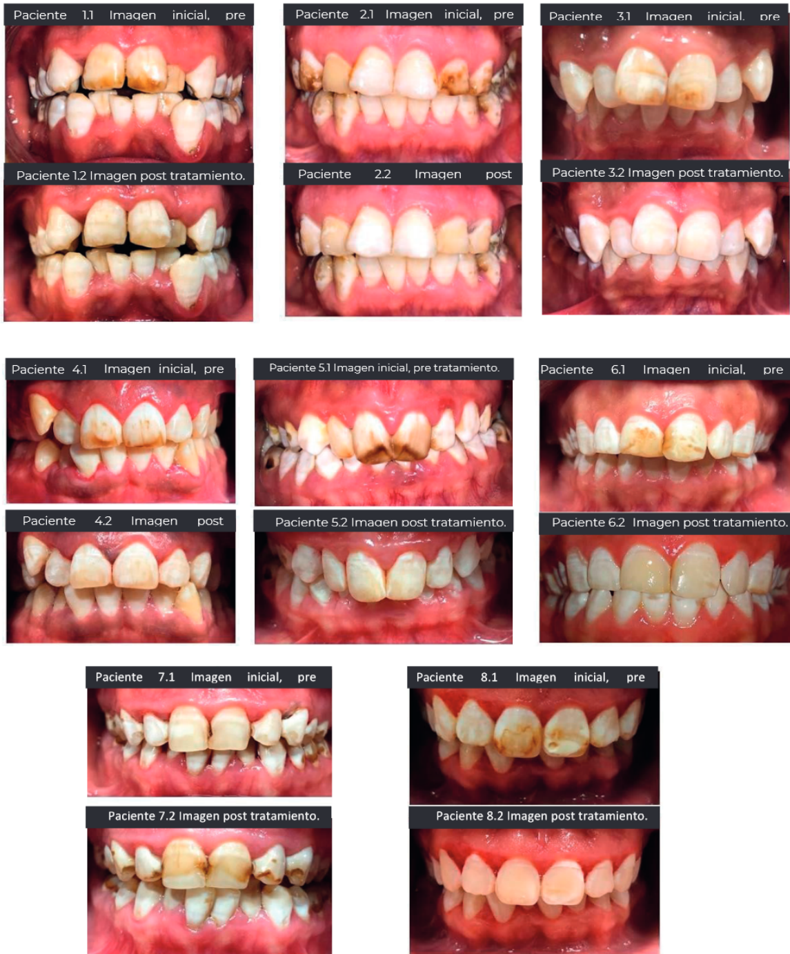
Figura 2 - Procedimiento Ácido Clorhídrico