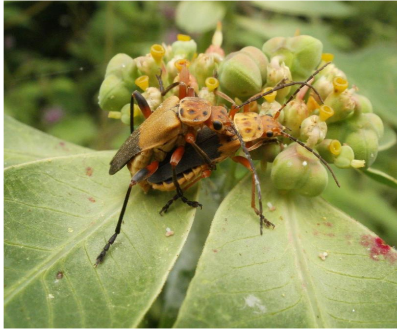
Figura 3. Chauliognathus forreri Gorham, 1885.