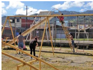
Figura 6 Jóvenes dan mantenimiento a infraestructura comunal en San Felipe de Alajuelita

“El Comité de la Niñez y [de la] Adolescencia colaborando en el mantenimiento de las áreas recreativas de la comunidad, y dando el ejemplo de que se pueden cuidar entre todos”