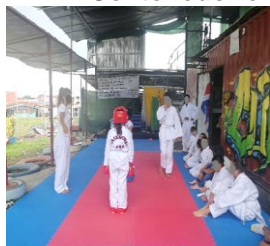
Figura 5 Contenedor en el que se enseña Karate en Los Cuadros

“Clases de Karate en contenedor que es el salón de cultura. Es importante hacer deporte. Ayuda a sacar a los jóvenes de la delincuencia. La Casa de la Cultura de Los Cuadros organiza esta actividad”