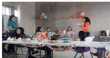
Figura 7 Recreación Social en Tirrasés: té de canastilla

“Amigos de La Cometa celebrando la llegada de un nuevo miembro a la familia de La Cometa.”