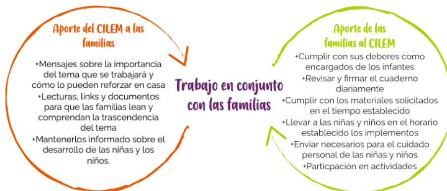
Figura 4 Propuesta de instrumento para involucrar a las familias en el trabajo que se realiza en el aula