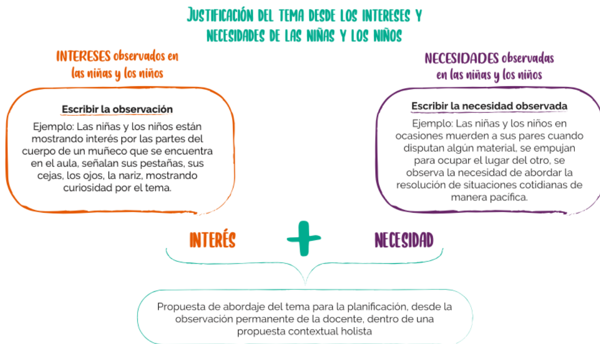
Figura 2 Instrumentos presentes en la Guía del CILEM que permiten orientar los procesos de mediación pedagógica desde un modelo de marco abierto