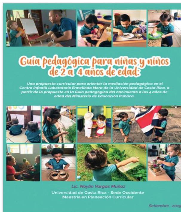
Figura 1 Portada de la guía pedagógica para niñas y niños de 2 a 4 años de edad, adaptada a las directrices del Ministerio de Educación Pública

El logro de este objetivo permitió elaborar la Guía pedagógica para niñas y niños de 2 a 4 años de edad en el CILEM. Este documento consta de los siguientes apartados: 1) Presentación. 2) Tabla de contenidos. 3) Introducción. 4) Glosario donde se clarifican términos que permiten una mejor comprensión de los procesos de mediación pedagógica desde un modelo de marco abierto. 5) Propósito de la guía. 6) El marco normativo. 7) Marco pedagógico, el cual define: Concepto de currículo, Elementos curriculares, Fuentes curriculares, fundamentos curriculares desde el enfoque socio constructivista y el modelo del CILEM. 8) Orientaciones específicas. 9) Organización y descripción de los ámbitos de aprendizaje.